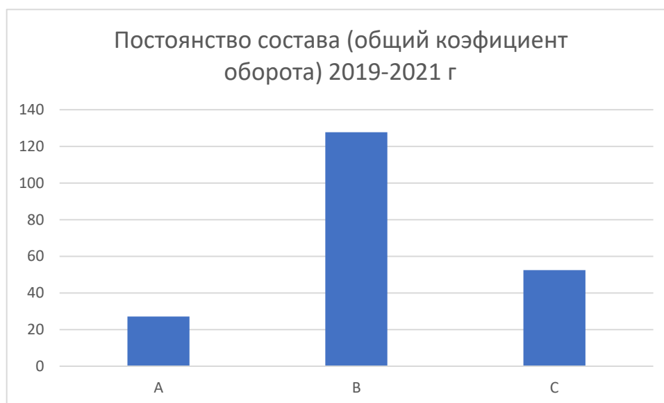
Рис.3 – Постоянство состава

Постоянство состава (общий коэффициент оборота) рассчитывался за весь период 2019–2021 г. На рисунке 3 у варианта «А» коэффициент составил 27,07, у варианта «В» 127,76, у варианта «С» 52,45. Т.е. учитывая обратную зависимость параметра с коэффициентом, самый высокий уровень постоянства состава продемонстрировал вариант «А». У варианта «С» постоянство состава почти в два раза меньше, а у варианта «В» показатель меньше в 4,7 раза. Высокий показатель коэффициента у варианта «В» скорее всего связан со сменой формы оплаты.